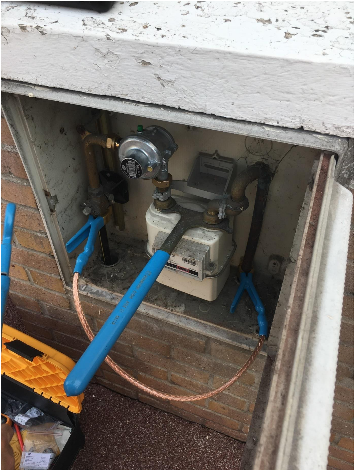
Légende : Changement de détendeur sur le poste gaz d'un particulier